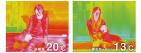
●ガス温水式床暖房と電気カーペットのサーモグラフィによる室温の比較

一般的な暖房は上部にいくほど温度が高くなり、顔は熱いのに足元は冷たいといった状況が起こりがち。しかし、床暖房なら足元からじんわりと体全体を暖め、さらに暖まった空気が対流するのでお部屋全体もムラなく均一に暖まります。